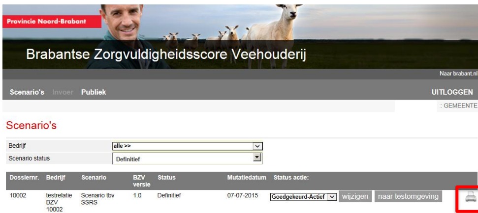
Figuur 6: Scenario afdrucken.

Met de printer button kunt u een pdf formulier van het scenario inzien en afdrucken.