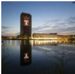
2.6 MB jpg lichtprojectiekoningsdag8.jpg