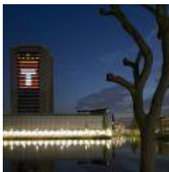
2.7 MB jpg