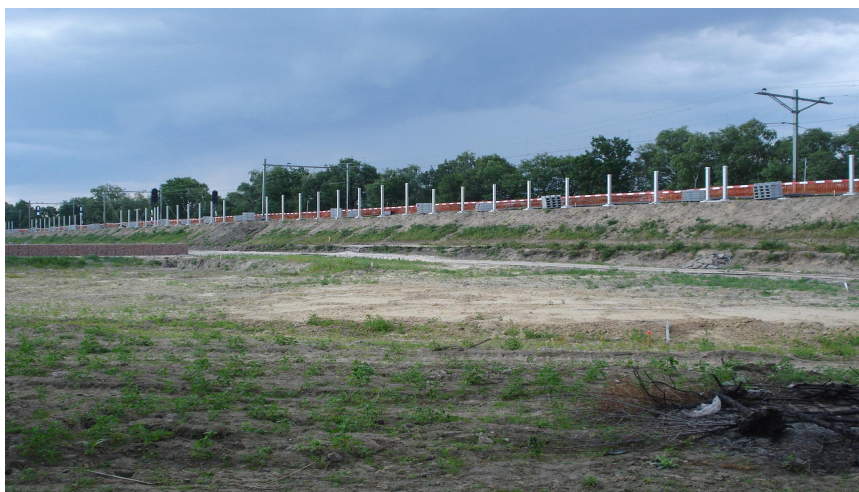
Foto 3.10: Compensatielocatie woonwagenlocatie Oude Doornakkersweg

Uit het veldbezoek is gebleken dat op de noordwestelijke ingreeplocatie nog een bosopstand aanwezig is. Er is daar dus nog geen bos gekapt voor de uitbreiding. Wel is gebleken dat op het perceel illegaal vuil wordt gestort. Verder heeft het veldbezoek uitgewezen dat op de locatie Randzone Urkhoven bos is aangeplant. Op de eigenlijke locatie voor de compensatie (nabij de woningbouw Tongelresche Akkers), hebben nog geen compensatiemaatregelen plaatsgevonden (zie foto 3.10). Hier zou elzenbroekbos worden gerealiseerd ter compensatie voor de uitbreiding van het woonwagenkamp.