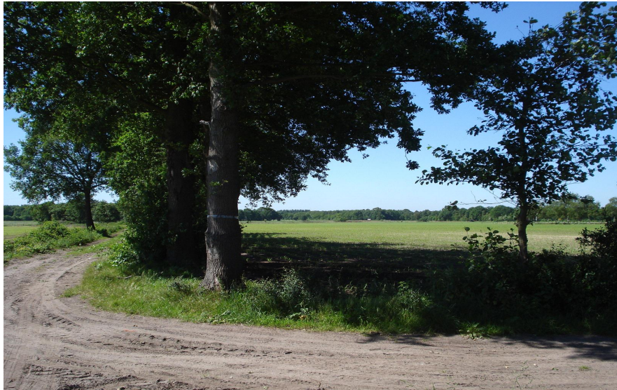
Foto 3.2: Compensatielocatie Het Vervul (links en rechts van het pad)