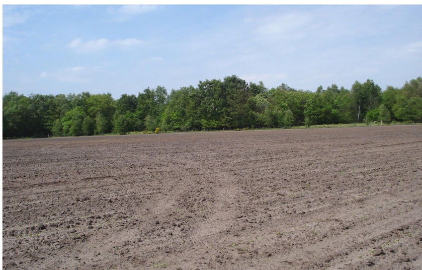
Foto 3.6: Compensatielocatie voor verlies aan bos door reconstructie N261

Op basis van het veldbezoek is niet duidelijk geworden of de ingreep al dan niet heeft plaatsgevonden. In elk geval zijn de compensatiemaatregelen nog niet uitgevoerd (zie foto 3.6. Het betreft hier een akkerperceel).