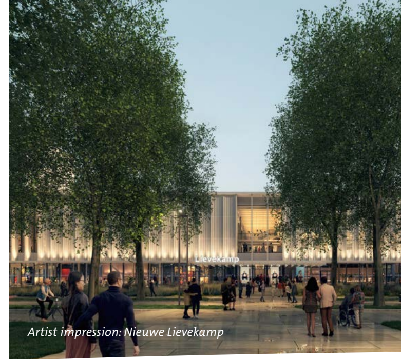
Artist impression: Nieuwe Lievekamp

‘Wees er voor alle Ossenaren. Wees eerlijk.’